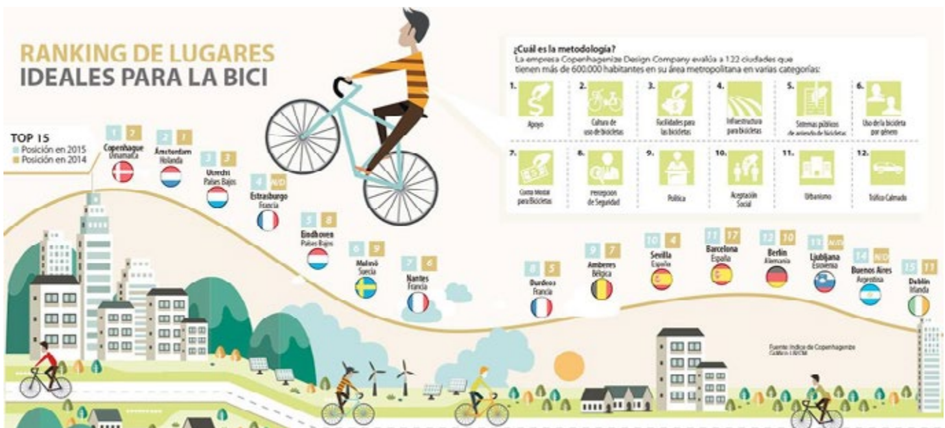
Figura 1. Ranking de lugares ideales para la bici.