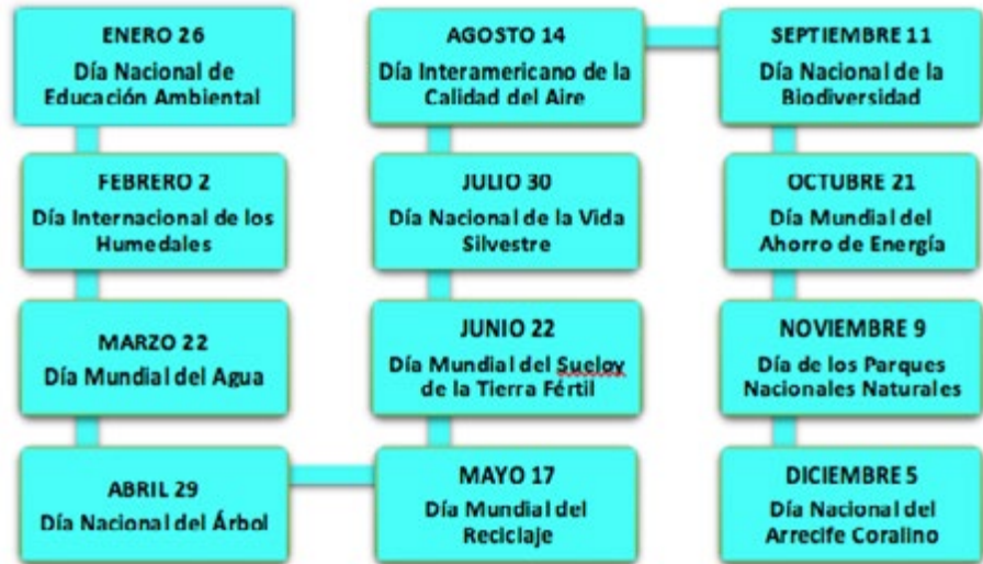
Ilustración (Ministerio de Ambiente y Desarrollo Sostenible de la República de Colombia, 2017)

De esta manera, se concluye que es vital en sentido literal, que TODOS reconozcamos que en nuestro país y en el mundo entero, sobran motivos y faltan acciones para adquirir hábitos de vida que no sólo beneficien nuestros propósitos personales, sino que contribuyan a generar una cultura ambiental en todos los espacios, en casa, barrio, colegio, parques e industrias, para proteger los recursos ambientales tan necesarios para nuestra vida; por tanto tenemos en espera una llamada de emergencia que suscita cambio para que sean siempre 365 Días Mundiales del Medio Ambiente.